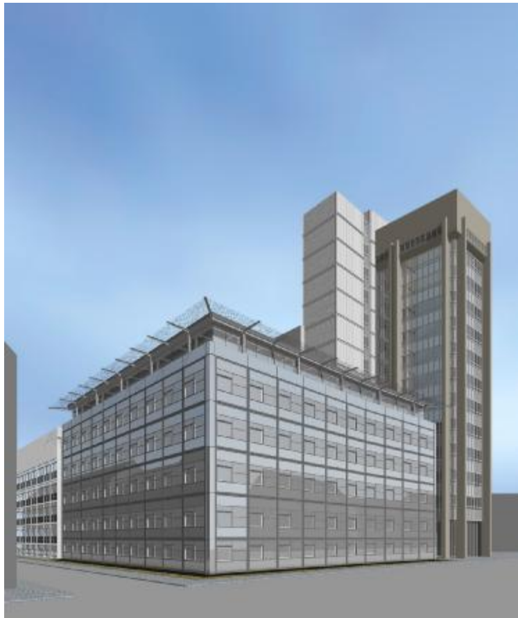
Entwurf: Architekt PSP - Pysall, Stahrenberg und Partner, Braunschweig

Das Bauvorhaben "Informatikzentrum TU Braunschweig" liegt nördlich des Braunschweiger Zentrums auf dem historischen Universitätsareal. Der sechsgeschossige Neubau grenzt direkt an die Ost- und Nordseite des Hochhauses "BS 4" der Technischen Universität und erschließt eine durchgängige Nutzung der Ebenen von Neu- und Altbau.